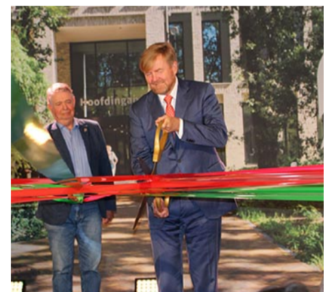
Koning Willem-Alexander knipt meerdere linten tegelijk door