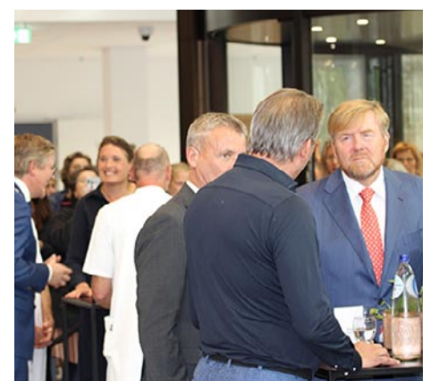
In de hal had de koning met diverse mensen uit de medische wereld een gesprek