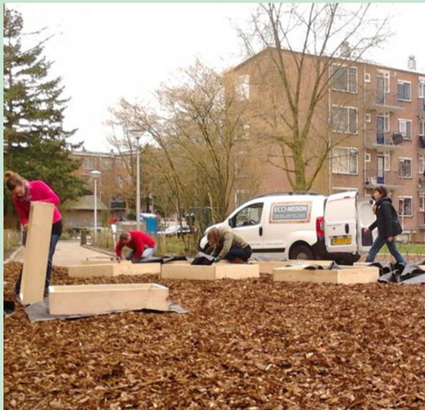
Tijdens NLdoet in 2014 zetten vrijwilligers de eerste moestuinbakken neer. Het begin van de Riebeecktuin!

Iets anders om naar uit te kijken is ons jubileum. Tien jaar geleden, in 2014, werden de eerste moestuinbakken geplaatst op het Elsplein. Om ons tienjarig bestaan te vieren zullen we verschillende activiteiten organiseren gedurende het jaar. Dit feestelijke jaar wordt afgetrapt tijdens NLdoet op zaterdag 16 maart. We gaan onder andere de moestuin opknappen en een mooie fruitboom planten! Help je mee? Je kunt meer informatie vinden en je aanmelden op nl doet.nl/activiteit/10-jaar-riebeecktuin .