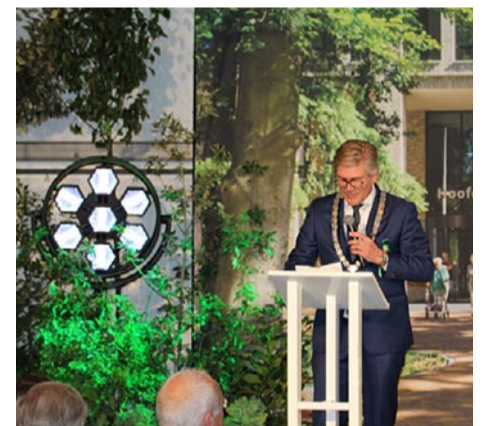
De wethouder hield een openings toespraak voorafgaand aan de officiële oeping