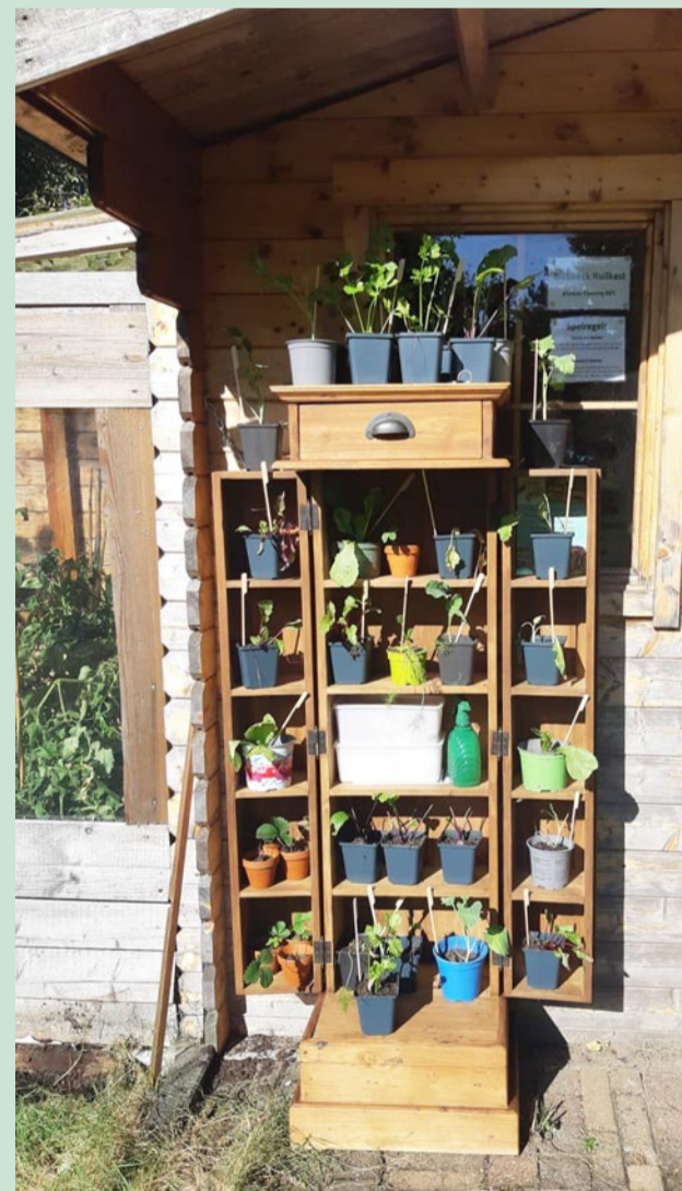
Na burendag was de nieuwe stekjesruilkast goed gevuld

'Dit feestelijke jaar wordt afgetrapt tijdens NLdoet op zaterdag 16 maart. We gaan onder andere de moestuin opknappen en een mooie fruitboom planten!'