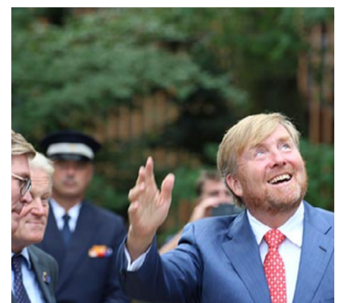
Aandacht voor het personeel dat zelfs tot op het dakterras stond te zwaaien