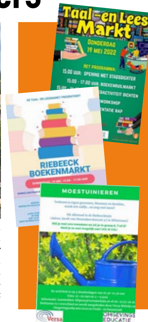
Voorbeelden van diverse activiteiten in de Riebeeck