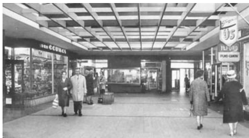
De galerij vlak na de opening

Zoals gezegd, als alles meezit hoopt de projectontwikkelaar eind 2023 aan de slag te kunnen.