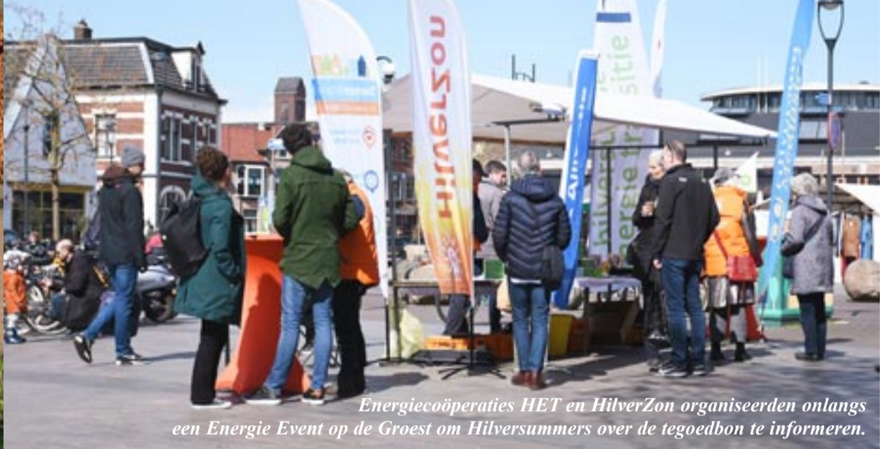
Energiecoöperaties HET en HilverZon organiseerden onlangs een Energie Event op de Groest om Hilversummers over de tegoedbon te informeren.

De gemeente Hilversum doet mee met een landelijke actie om energie te besparen. Dat is goed nieuws voor Hilversumse huurders, want zij kunnen daardoor een gratis tegoedbon van 70 euro aanvragen, waarmee zij duurzame producten kunnen bestellen. Twee jonge huurders in Hilversum Centrum pakte deze kans met beiden handen aan.