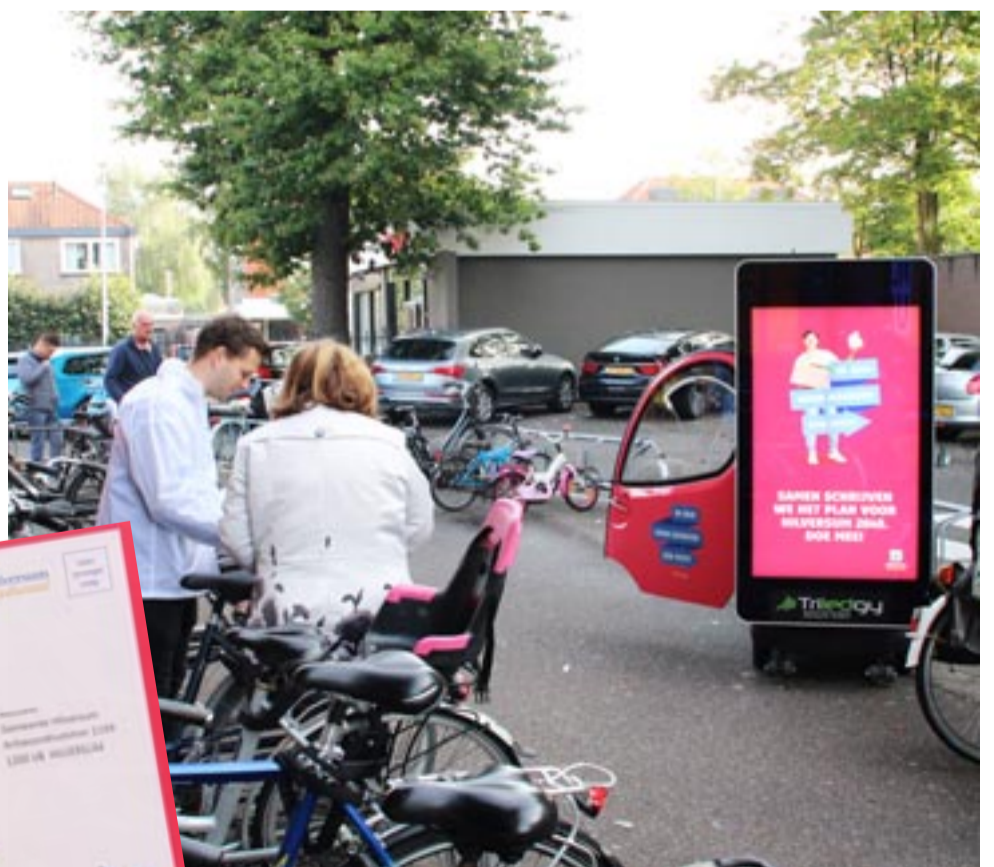
Het promotieteam aan het werk in Hilversum.