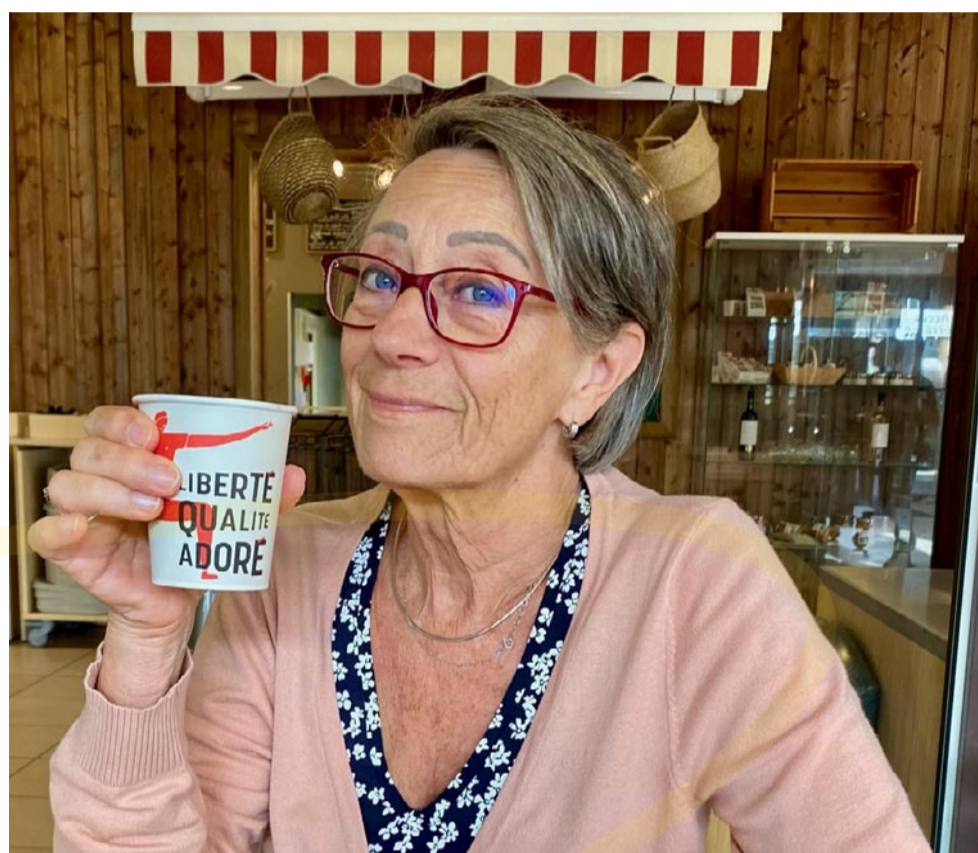
Vrijwilliger Hospice Kajan Fia

“Weet je nog? vroeg mijn man. Ik had die dag bij toeval iemand ontmoet die vrijwilligerswerk deed in een hospice. Hij herinnerde mij eraan dat ik altijd heb gezegd dit ook te willen doen wanneer ik er tijd voor zou hebben. De volgende dag heb gebeld met hospice Kajan. Dat is een klein jaar geleden.”