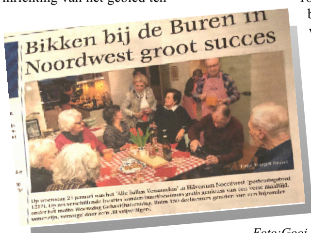
januari '19

VOOR DE VOLGENDE KIJK OP JOUW WIJK ZOEKEN WE VRIJWILLIGERS DIE DE KRANT IN HUN BUURT OF STRAAT WILLEN BEZORGEN. INFO KRIJG JE VIA info@kijkopjouwwijk.nl