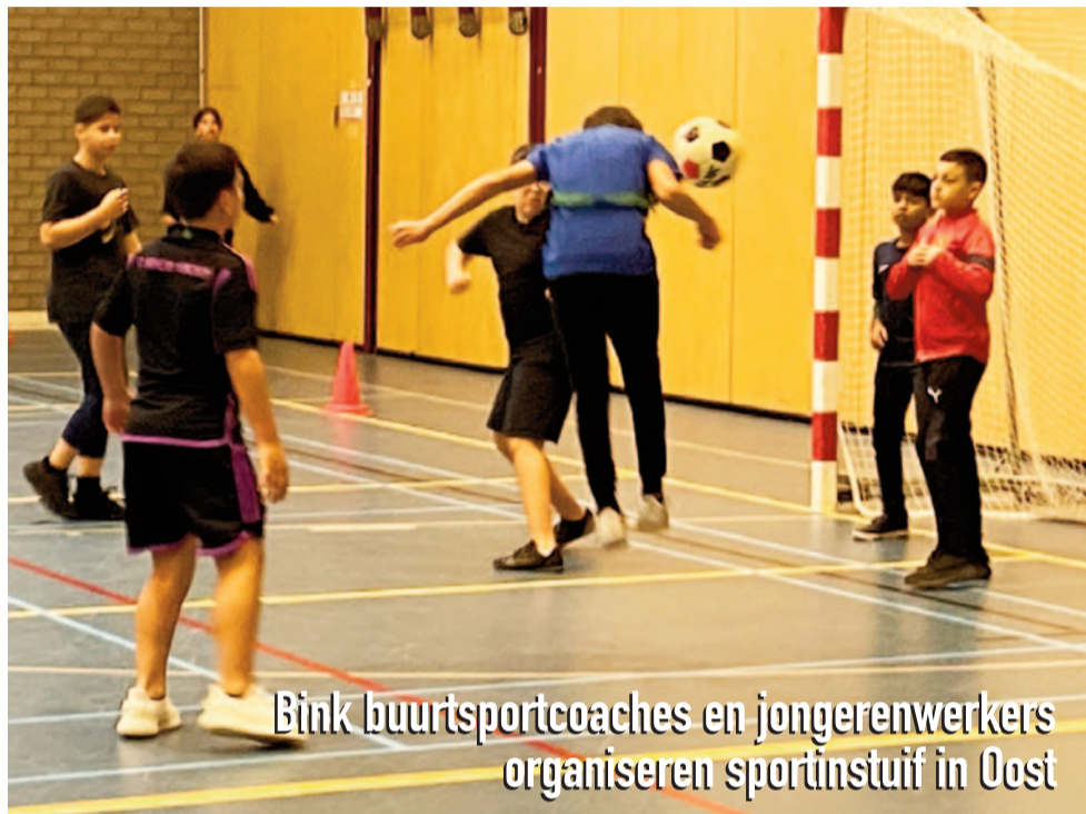
Bink buurtsportcoaches en jongerenwerkers organiseren sportinstuif in Oost

(*) Inmiddels is de uitslag van de enquête bekend: 89% van de deelnemers stemde tegen de auto-te-gaststraat. Ga naar 1221.hilversum.nl en kies voor Bruisend Hart en actueel voor alle resultaten.