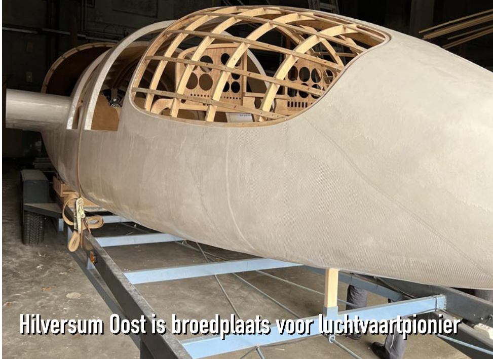
Hilversum Oost is broedplaats voor luchtvaartpionier

Ruim 3600 uur werk zit er al in het vliegtuig dat Chris Rijff in zijn hangar bij Vonk in de Wijk bouwt. Zolang het niet vriest werkt de Hilversummer dagelijks aan zijn prototype voor een amfibievliegtuig. Het toestel wordt ontworpen om op waterstof te vliegen en is geschikt voor één piloot en zeven passagiers.