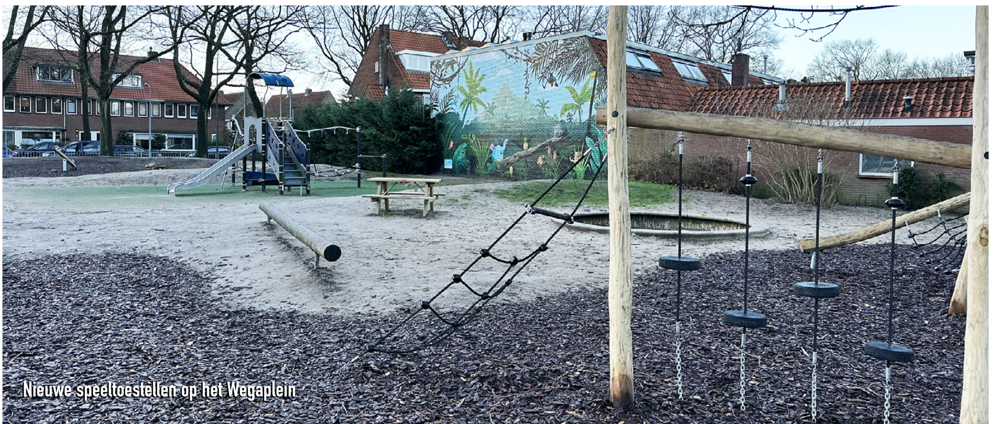
Nieuwe speeltoestellen op het Wegaplein