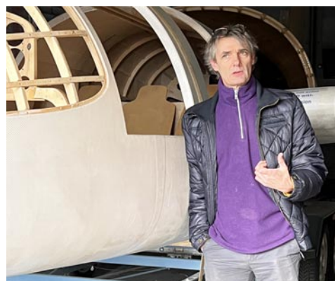
Lees verder op pag. 2

De vleugels van het vliegtuig zijn nog niet af, maar dit kan wachten volgens