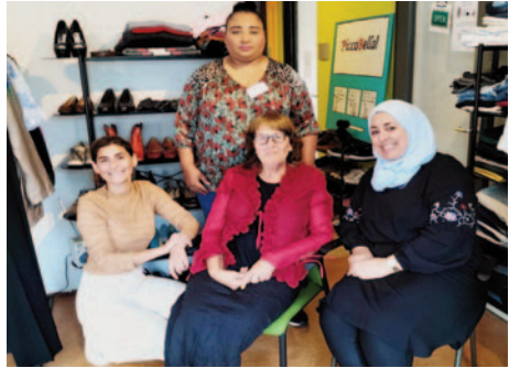
De vrijwilligers van Picco Bello

Vaste bezoekers van St. Joseph kennen Picco Bello wel. Het winkeltje met tweedehands kleding zit er al jaren, maar is onlangs helemaal opgeknapt. Een buurtbewoonster is dol enthousiast over het aanbod en schreef het onderstaande stukje.