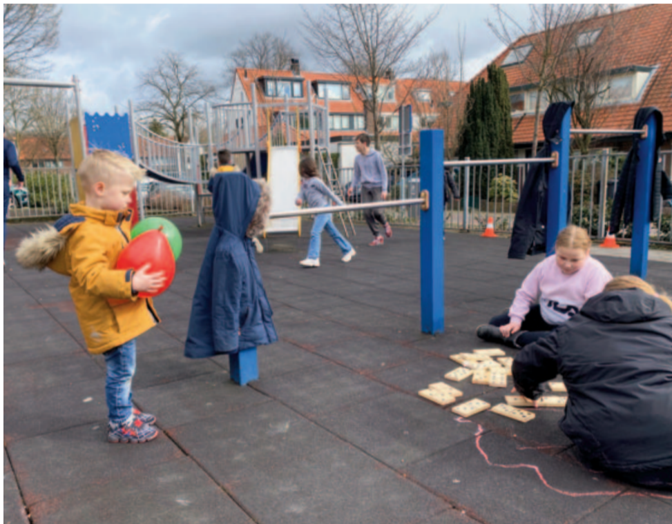
Hoepels, ballen, dominostenen: elke week komt het Kinderwerk langs met leuke dingen om te doen voor de kinderen in de Electrobuurt.