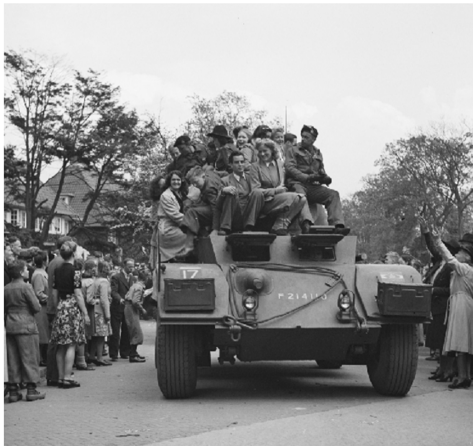
Duizenden Hilversummers hebben in 1945 de bevrijders verwelkomd.

info@kijkopjouwwijk.nl. Wie weet komt jouw initiatief in de volgende krant.