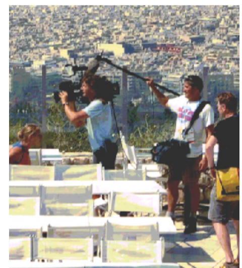
Opnames met rolstoeltennister Esther Vergeer, Athene, Olympische Spelen 2004

Mijn programma's moeten spannend, leuk en aantrekkelijk zijn. Nieuwe technieken - zoals animaties,