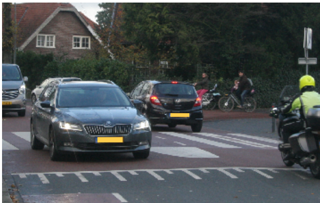
Situatie hoek Jan van der Heijdenstraat / Radiostraat: sprinten voor je leven, voorrang krijgen als fietser is een unicum.

per uur vrijwel geen kans voor, laat staan bij vijftig kilometer per uur.