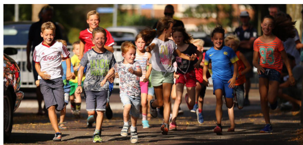
Meedoen is belangrijker dan winnen in de Radiostraatloop

In de Radiostraat waren de reacties echter zo positief, dat we er een echt straatgebeuren van gingen maken. Met heuse inschrijfformulieren en mailingen werd het Radiostraatfeest ver van tevoren aangekondigd. Zo gebeurt dat nog steeds, hoewel veel communicatie nu via radiostraat.nl en een groot mailadressenbestand gaat.