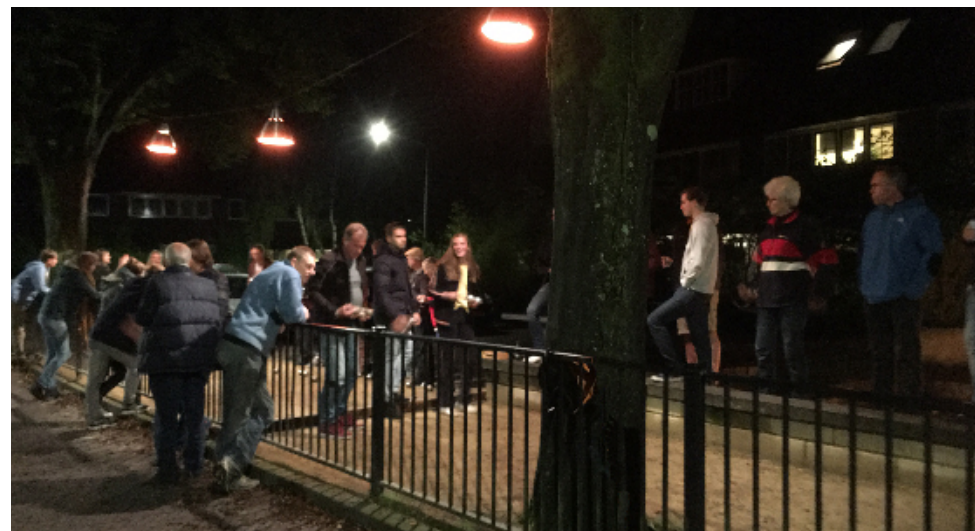
Een gezellige sfeer tot in de kleine uurtjes op de 'Bouledrome' in de Radiostraat

weersomstandigheden het straatfeest moeten afgelasten. Maar met een grote tent en een droge en soms zonnige tweede helft van de dag was de sfeer van dit jubileumfeest als vanouds en gingen de laatste burens na middernacht pas naar huis.