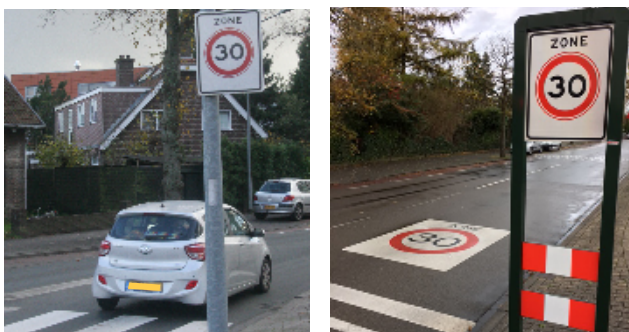
Links zoals de 30 km zone op de Jan van der Heijdenstraat wordt aangegeven en rechts zoals het -veel duidelijker- op de Van Riebeeckweg is gedaan...

Boos worden op die fietsers kun je niet, want ze kiezen de veiligste weg. Immers, als je Seinhorst wilt oprijden of de Radiostraat in wilt, moet je voorsorteren en daar krijg je bij dertig kilometer