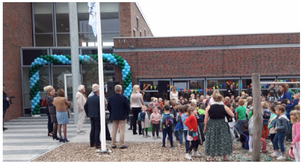
Veel ouders en kinderen op het openingsfeest van Villa Vrolik