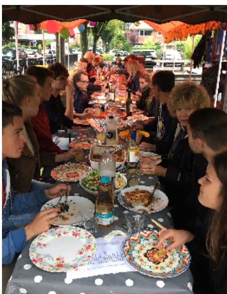
Traditie tijdens het Radiostraatfeest: met z'n allen eten aan lange tafels

De vorige eigenaren hadden zich jarenlang ingezet voor een verkeersluwe straat. In die tijd zat Philips nog aan het begin van de straat en was er veel sluisverkeer. Het latere Den Uylplein zorgde